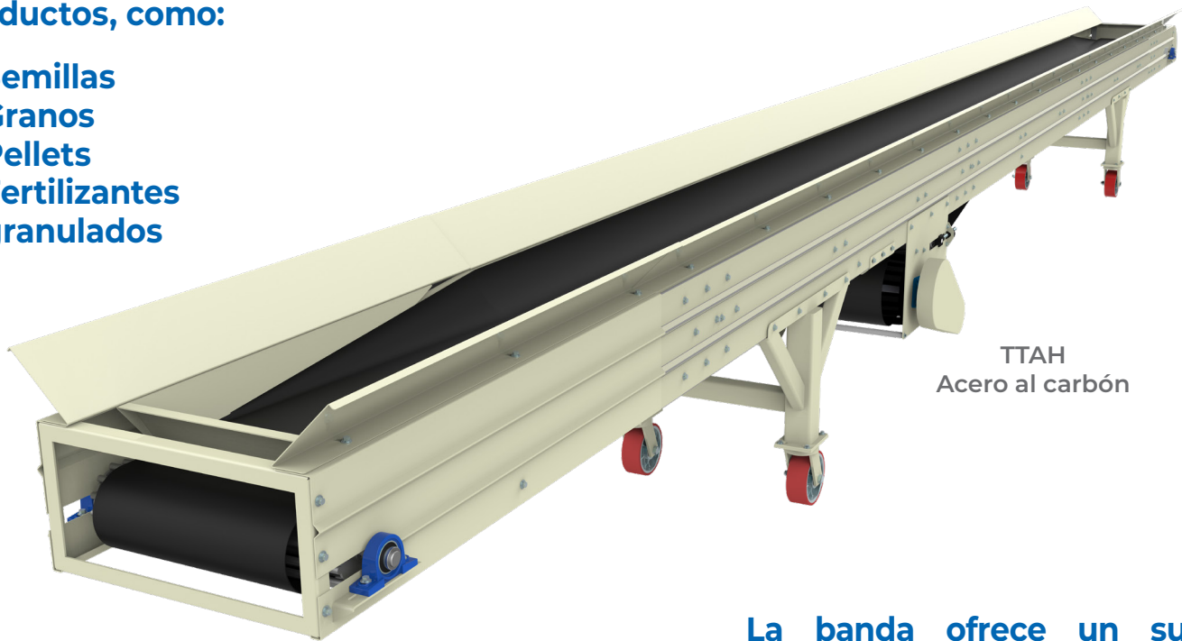
TTAH Acero al carbón

La banda ofrece un suave manejo evitando así romper o moler el producto, eliminando el costo por mermas y respetando la presentación de los mismos.