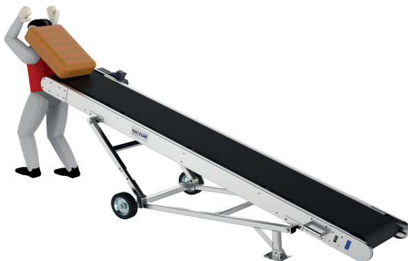
THCII-10 Acero inoxidable

Equipo más apropiado para realizar movimientos de sacos de una manera rápida y eficiente, llevando los sacos a altura del hombro, cabeza u ombligo. Gracias a la versatilidad de su diseño puede fácilmente desplazarse de un lugar a otro.