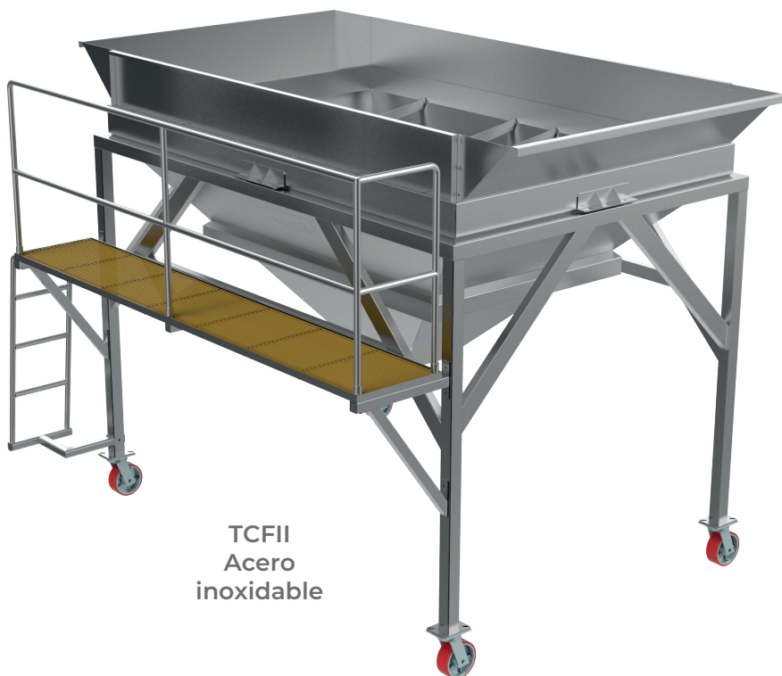
TCFII Acero inoxidable

Gracias a su diseño se puede transportar dentro y fuera de bodegas, puertos marítimos, espuelas de ferrocarril, plantas de proceso, etc.