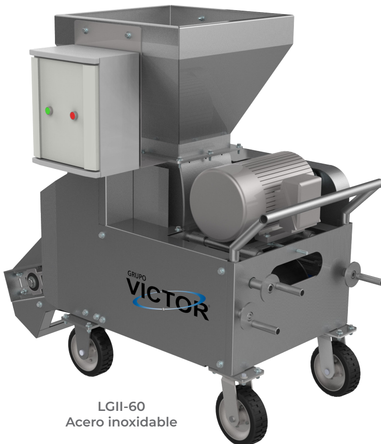
LGII-60 Acero inoxidable

El lanzador es fácilmente transportable dentro y fuera de su bodega, alcanza una distancia de hasta los 10 m. Tiene potente motor de 10 HP y una banda de lanzamiento de 13" de ancho.