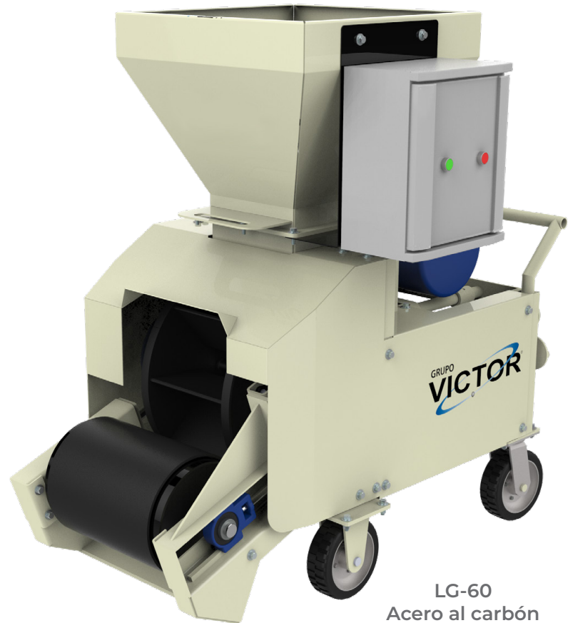
LG-60 Acero al carbón