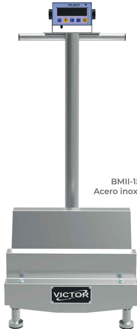
BMI-150 Acero inoxidable

El peso puede mostrarse en kilogramos o en libras, pudiendo registrarse en cualquiera de ellos un valor de tara. Debido a su diseño, tamaño reducido y ligereza puede ser fácilmente transportada al lugar donde se necesite